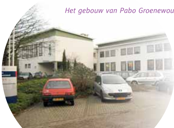
Het gebouw van Pabo Groenewoud