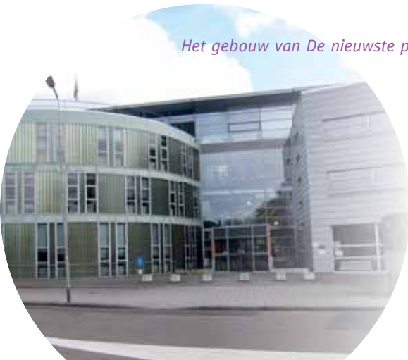
Het gebouw van De nieuwste pabo

In het werkveld heeft men niet altijd een duidelijk antwoord op de genoemde vragen. Daaruit blijkt een lacune in kennis. Daar moeten we aan werken. Ook de overgang van voorbereidend naar aanvankelijk lezen is zo'n