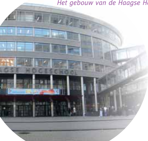
Het gebouw van de Haagse Hogeschool

Studenten kunnen kiezen voor groep 1-2, 3-4-5 of 6-7-8. De specialisatie kleuters werkt met een eigen curriculum, dat een wezenlijk andere inhoud heeft dan de specialisaties midden- en bovenbouw voor de groepen 3 t/m 5 en 6 t/m 8. Hierdoor wordt specifieke kennis over de kleuterdidactiek aangeboden.